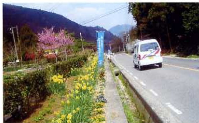
町をきれいにする運動 平成19年7月15日(佐伯区湯来地区)