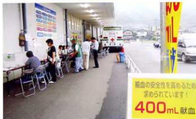
献血受付風景 平成19年6月24日(安芸区中野地区)

地域における環境保全美化の実践・啓発と保健衛生意識の向上を目指すための募金です。その募金の一部は、各学区（地区）へ配分金として還元し、それぞれ地域の公衆衛生推進協議会の活動資金に活用されています。