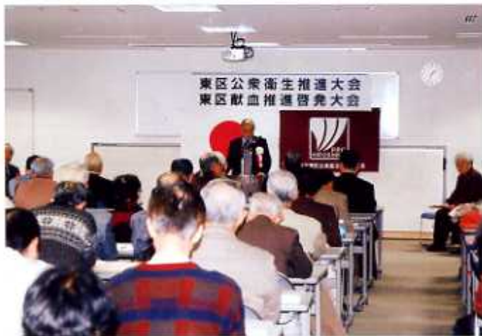
総会 平成19年4月27日(東区)

地域住民の連帯意識と人間関係づくりのため、各種役員会議・専門委員会・総会を計画的に実施する。また、各区、学区（地区）においても役員会や総会、及び地域の保健衛生や環境保全など諸問題の協議研究活動を通して組織の育成強化を図る。