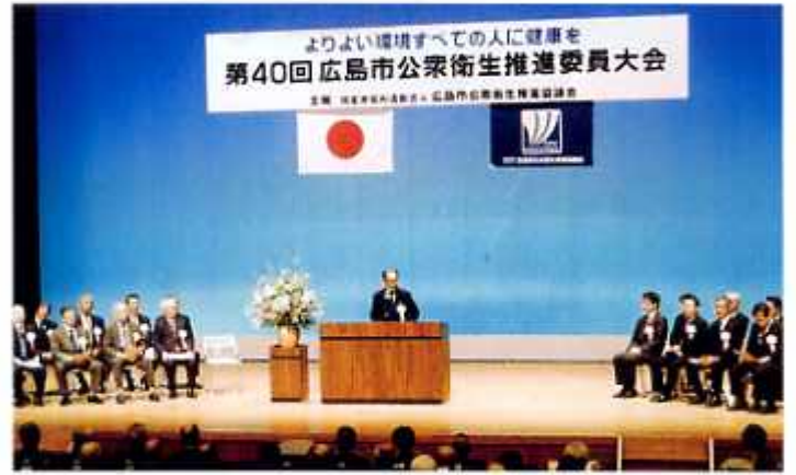
推進委員大会 平成19年10月12日(西区民文化センター)

広島市公衆衛生推進委員としての自覚を高め、地区の公衆衛生活動(コミュニティづくり)の推進と、併せて永年この活動に寄与した功労者をたたえ表彰式を行い、一層の発展を図るため大会を開催する。