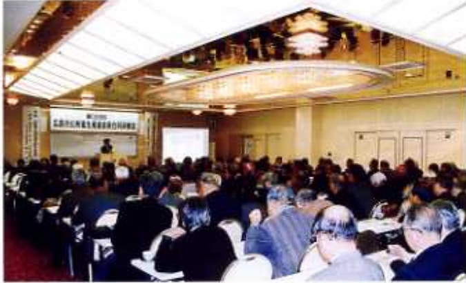
合同研修会 平成20年1月24日(広島サンプラザ)