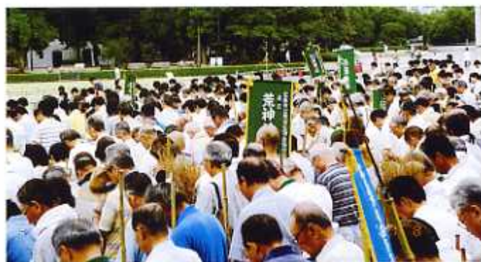
平和記念公園一斉清掃 平成19年8月2日(市公衛協)