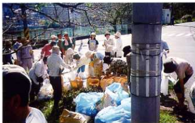
「町ぐるみ一斉清掃」 平成19年9月9日(中区白島学区)