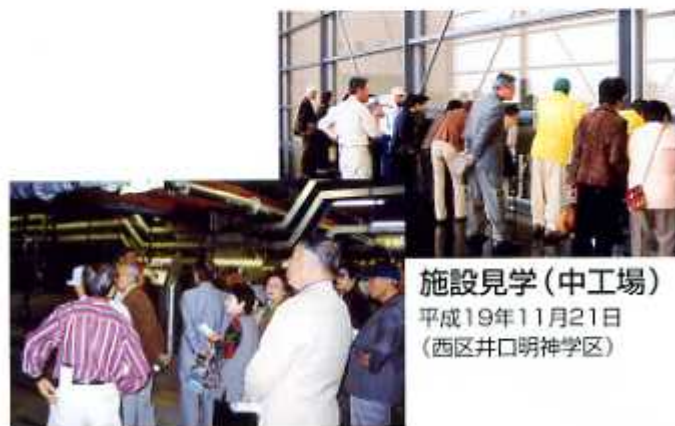
施設見学(出島処理場) 平成19年11月7日(西区観音学区)