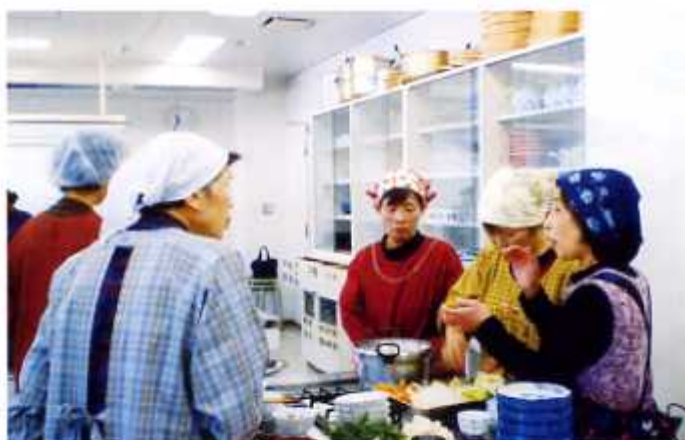
健康教室の開設 平成19年12月6日(安佐南区戸山学区)

各学区(地区)毎に健康教室・環境講座を開設し、専門講師を招くなどして知識の普及・実践化を図る。